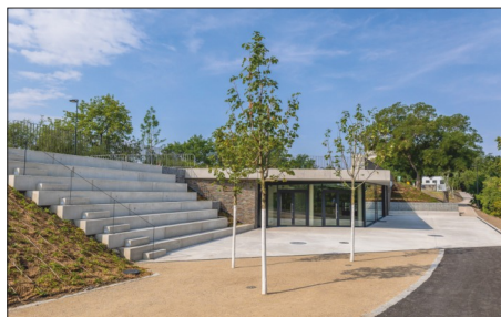
Nové bistro v parku na Vítkově se střešní zahradou (zelenou střechou)