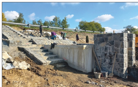
Z průběhu revitalizace retenční nádrže Rezerva v Kunraticích