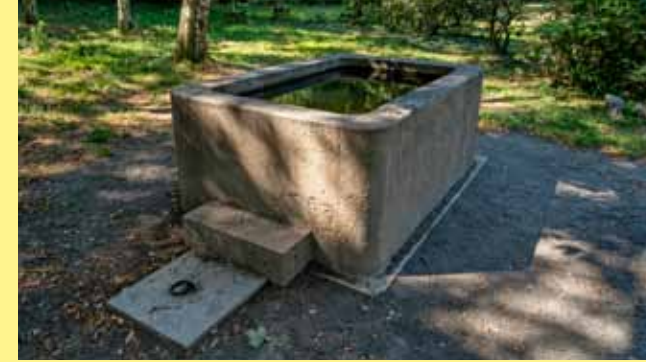
▲ Bývalé pítka pro koně