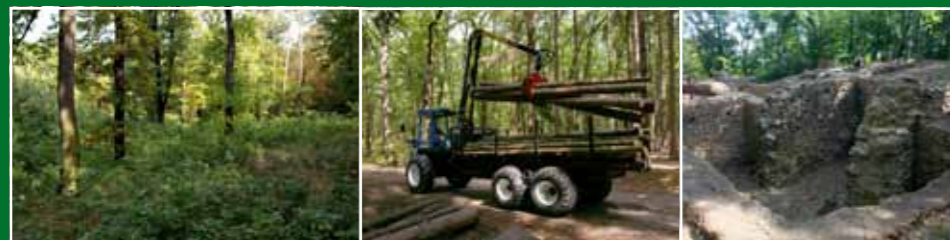
Přirozené zmlazení dubu

V Kunratickém lese převažují porosty dubu a smrku. Smrkové monokultury se však postupně přeměňují na smíšené porosty s převahou dubu, blíží se původnímu přirozenému složení porostů v dané lokalitě. V lese jsou prováděny prořezávky a probírky porostů a výsadby stromků v rámci obnovy porostů. Velký důraz je kladen na obnovu lesa přirozeným zmlazením (především dubu). Tyto zásahy směřující k vyšší přirozenosti lesních porostů jsou prováděny i v chráněném území Údolí Kunratického potoka.