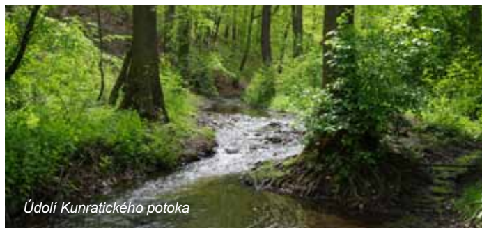
Údolí Kunratického potoka

Pohodlná cesta stále společně se žlutou vás dovede k restauraci U Krále Václava IV. Zde je dále dětské hřiště a zookoutek. Zanedlouho minete další restauraci Na Tý louce zelený. Stále pokračujte po žluté značce. Po levé straně budete mít oplocení Thomayerovy nemocnice.