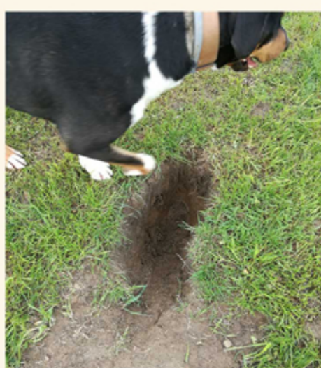
psí exkrementy a vyhrabávání děr