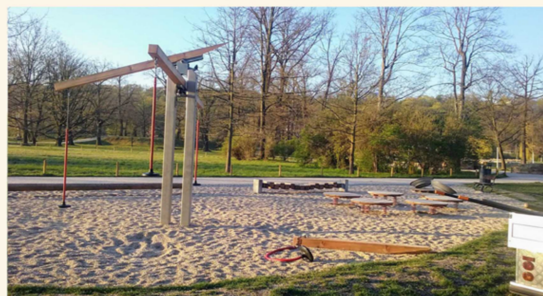
poškození mobiliáře a herních prvků