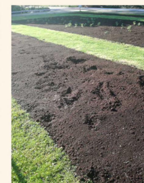
poškození dřevin a květinových záhonů