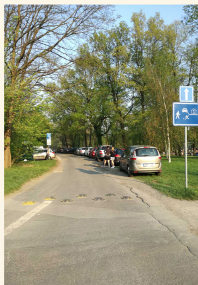
parkování v trávniku