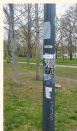
graffiti, nelegální polepy