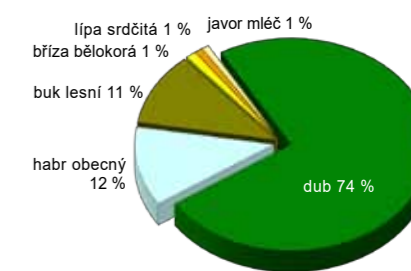
2. Ideální (přirozené) zastoupení dřevin