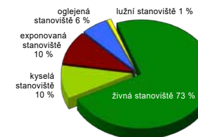
3. Rozložení jednotlivých stanovišť