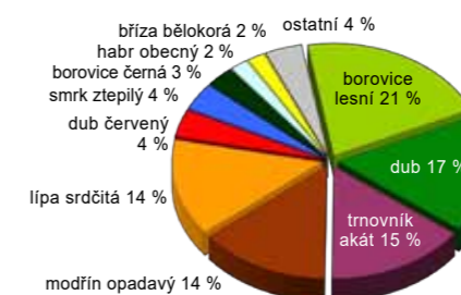
1. Stávající zastoupení dřevin

Modrá linie vyznačuje hranici dnešní Hostivařské přehrady. Ve střední části mapy jsou zakresleny budovy – mlýn, který byl při výstavbě přehrady zatopen.