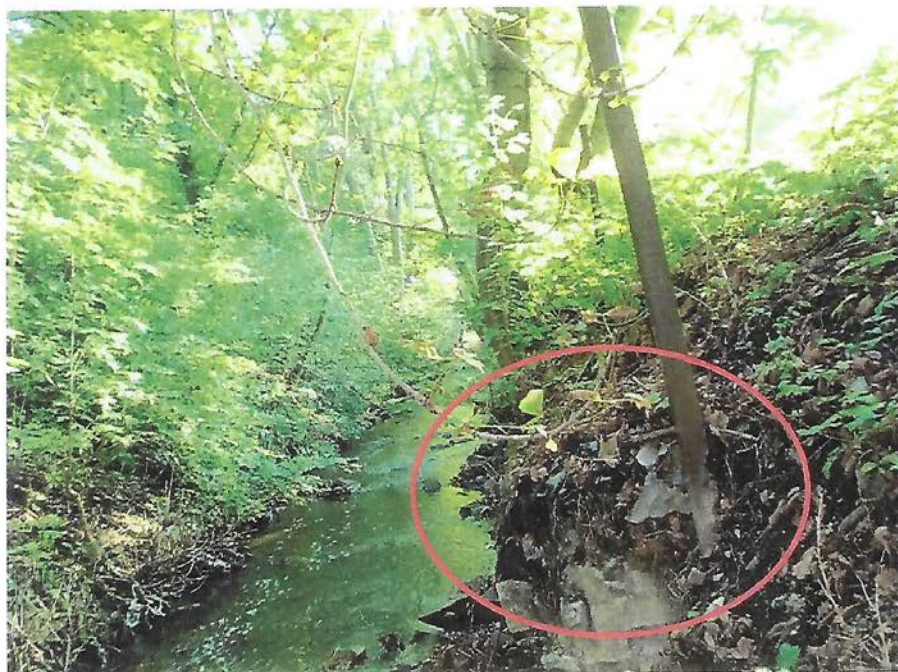
Historické skládky na břehu potoka

Fotodokumentace k revitalizaci Dalejského potoka: