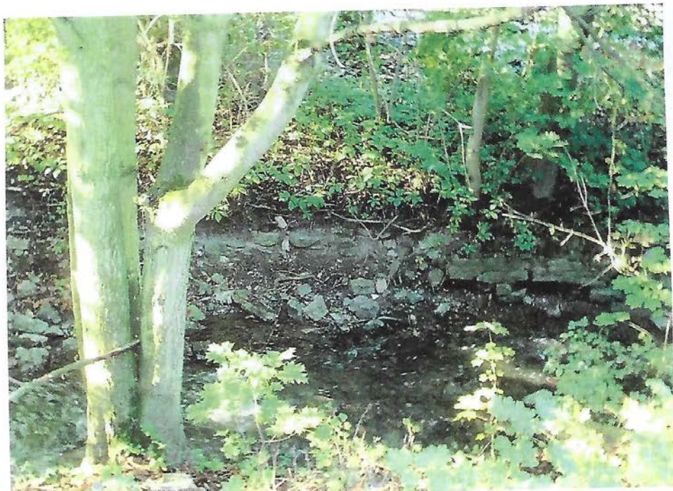
Původní rozpadlé zidky