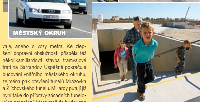
PRAŽANÉ se o novinky v dopravě zajímají, rádi využili i nedávny Den otevřených dveří na budované konečné trase C v Letňanech.