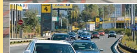
NOVOU ZÁŘÍ DEPO V HOSTIVĀŘI