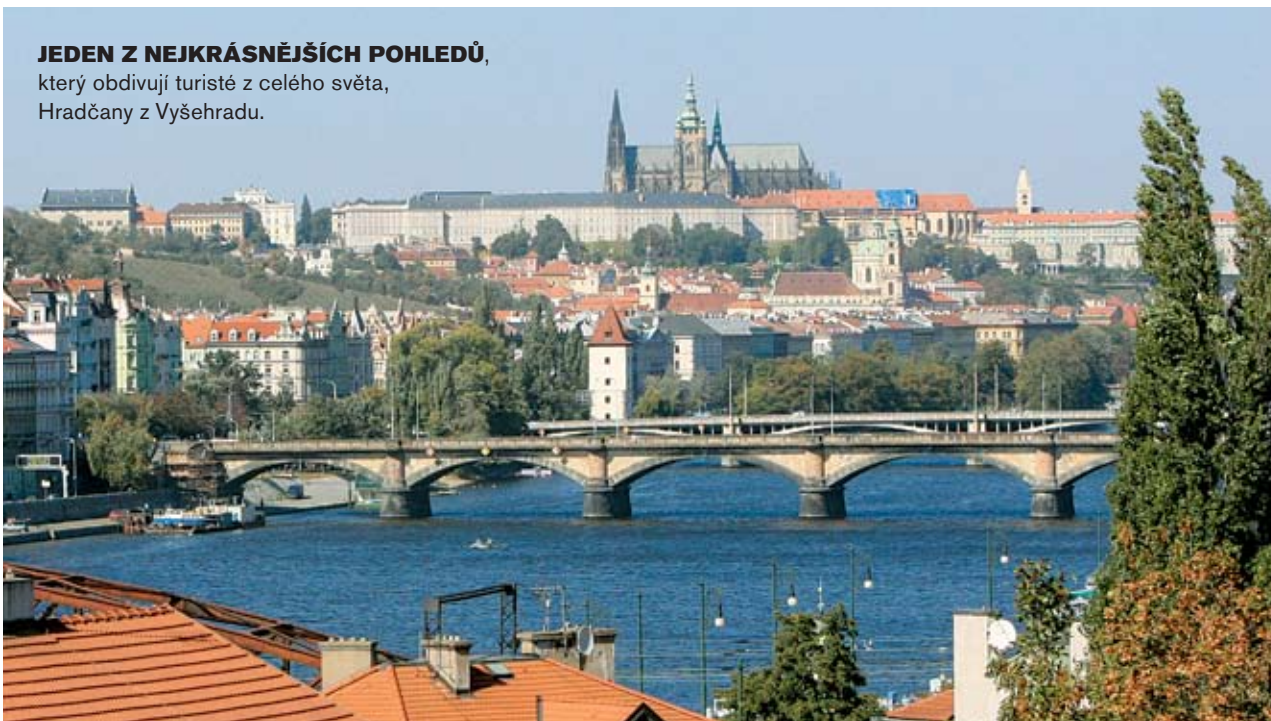
JEDEN Z NEJKRÁSNEJŠÍCH POHLEDŮ, který obdivují turisté z celého světa, Hradčany z Vyšehradu.