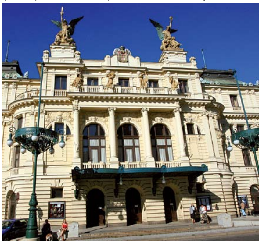
DIVADLO NA VINOHRADĚCH bylo zařazeno do městského kulturního fondu a patří tak k prioritám pražské kultury.

Za velký přínos lze především označit nový způsob přidělování grantů. Celková částka na granty byla v roce 2006 zvýšena, peníze budou ovšem moci získat jen projekty s transparentním účetnictvím. Novinkou od roku 2007 jsou obligatorní veřejná slyšení a prezentace u grantů převyšujících jeden milión Kč. O grantech budou nadále kromě politiků rozhodovat rovněž odborníci v komisi složené z volených zástupců města, specializovaných odborníků v oblasti kultury a ekonomů. Nová pravidla stanovují limit, do kterého hlavní město na kulturní akce přispěje. Příspěvek na kulturní akce vždy musí být jen do výše vyrovnaného rozpočtu. U těch projektů, kde je vybíráno vstupné, nesmí pod-