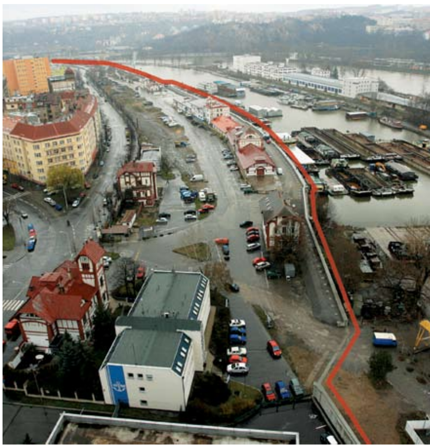
VYBUDOVÁNÍ PROTIPOVODŇOVÝCH ZÁBRAN bylo na mnoha místech spojeno s úpravami povodni zaplavených míst. Do nové krásy tak například vyrostl holešovický přístav. Na snímku zřetelná protipovodňová hráz.

Protipovodňová ochrana Prahy přitom patří v Evropě mezi nejoslovnější systémy a v České republice nemá obdoby. Pražská radnice je také jediná, která dodržela slib a systém ochrany skutečně postavila. Stát přitom na tyto účely poskytl Praze jen sedm milionů korun, za které město upravilo část kanalizace. Město do ochrany investovalo asi 3,5 miliardy korun, přičemž po povodních v roce 2002, které lze hodnotit i jako nej-