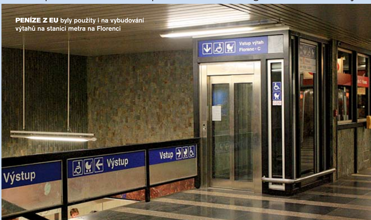
PENÍZE Z EU byly použity i na vybudování výtahů na stanici metra na Florenci