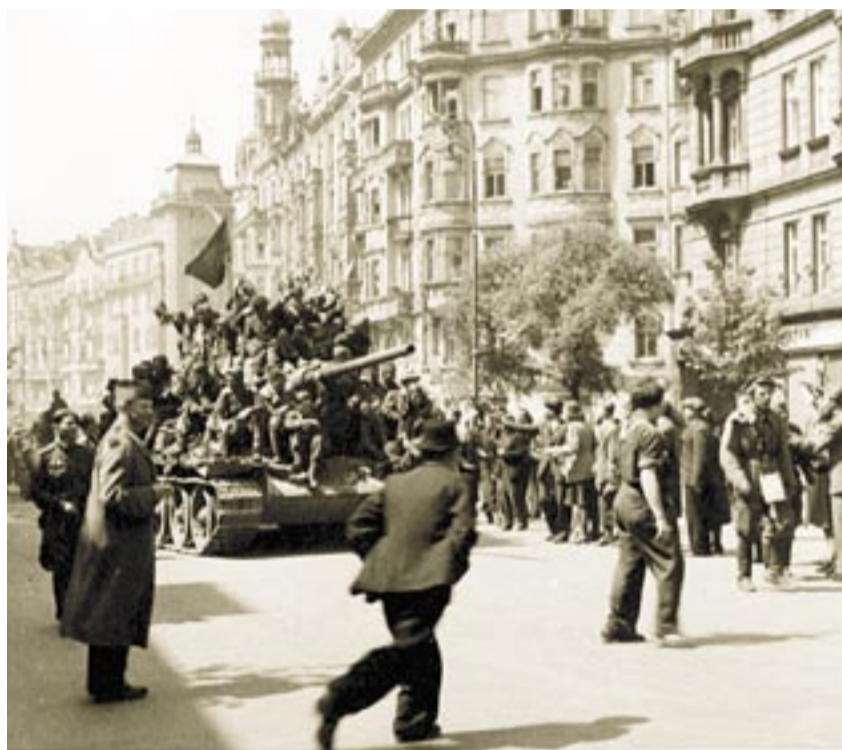
VÍTÁNÍ OSVOBODITELŮ. Historický snímek příjezdu osvoboditelů do Prahy.

Dezorientované jednotky SS se vzmáhají jen na chabou obranu, a tak může sovětský rozhlas o pár hodin později ohlásit: „Armády 1. ukrajinského frontu díky bleskurychlému nočnímu manévru tankových jednotek a pěchoty zlomily odpor nepřítele a dnes, 9. května ve čtyři hodiny ráno, osvobodily od německých okupantů hlavní město našeho spojeneckého Československa – Prahu!“ Na některých jiných místech Čech se ale Němci stále ještě