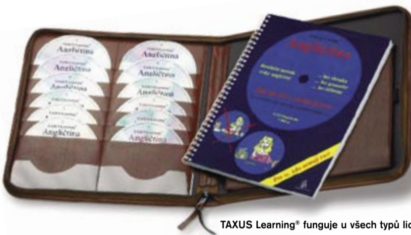
TAXUS Learning® funguje u všech typů lidí.

se ocitli. Učíme se posloucháním skutečné mluvené řeči, dokonce i střídáním britské a americké angličtiny a také i nespisovné angličtiny, anebo běžných slovních obrátů. Občas jsou dokonce zaměněné úlohy mezi mužem a ženou. I toto je jedinečnost výuky angličtiny metodou TAXUS Learning®.