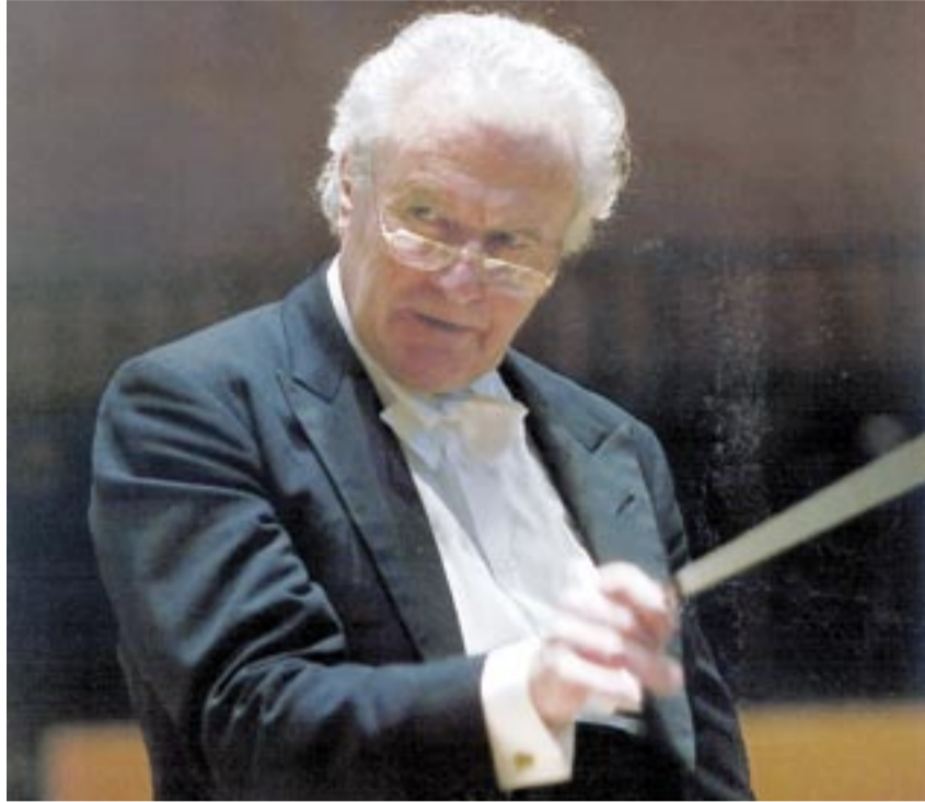
HVĚZDA FESTIVALU. Smetanova Má vlast letos zazní pod taktovkou světoznámého dirigenta Sira Colina Davise, šéfa Londýnského symfonického orchestru.

První ročník Pražského jara byl ve znamení nadšení celého národa ze znovunabytých svobody. V roce 1946 slavila Česká filharmonie padesát let, a proto jí byl vzdán hold nejvyšší – byla hostem všech orchestrálních koncertů. Pražské jaro si rychle našlo své místo na světové hudební scéně. Na pražských pódii přijímali nadšené ovace Karel Ančerl, Leonard Bernstein, Sir Adrian Boult, Rudolf Firkušný, Jaroslav Krombholc, Rafael Kubelík, Maura Lympany, Jevgenij Mravinskij, Charles Munch, Ginette Neveu, Jarmila Novotná, Lev Oborin, David Oistrach, Jan Panenka a další světoví umělci. Od roku 1952 je festival zahajován cyklem symfonických básní Má vlast Bedřicha Smetany. Ten tentokrát zazní pod taktovkou šéfa Londýnského symfonického orchestru Sira Colina Davise. Ve festivalové historii se ten-