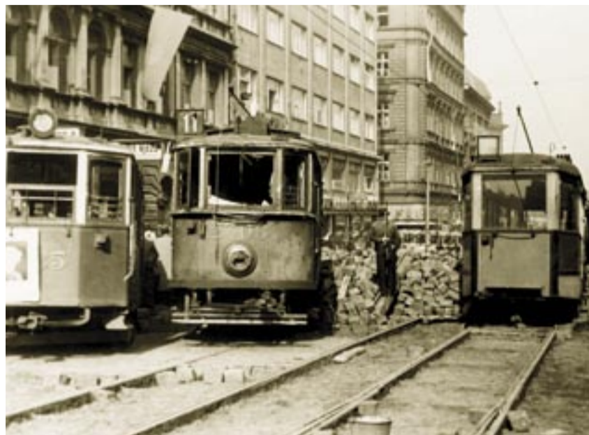
TRAMVAJE V BARIKÁDÁCH. Pražané použili na stavbu více než 1600 barikád vše, co bylo po ruce. Někde posloužily i vozy tramvají.

Přestože německý policejní prezident zakázal shromažďování na ulicích, už během dopoledne začali lidé odstraňovat německé nápisy a vyvěšovat československé vlajky. Motorem povstání se stal rozhlas. Od šesti ráno hlásil už pouze češsky. Okupační síly se k němu vrhly, aby jej umlčely. Češi v rádiu začali volat o pomoc. O budovu se strhla nerovná bitva. Padlo při ní na 90 bojovníků a stovka jich byla zraněna. V 18 hodin se německá posádka vzdala. Němci byli odhodláni bránit českou kotlinu proti