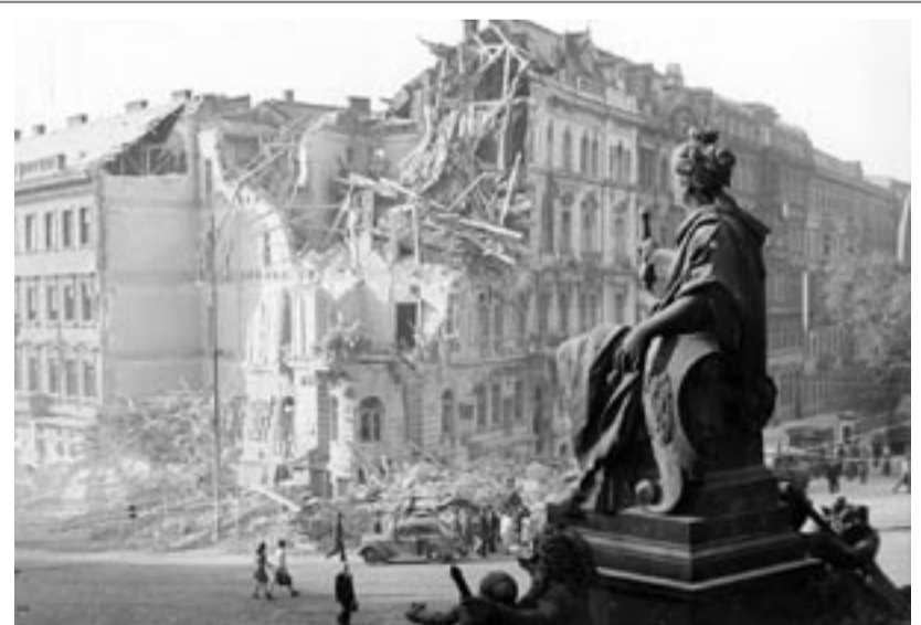
Vaclavské náměstí v květnových dnech 1945...