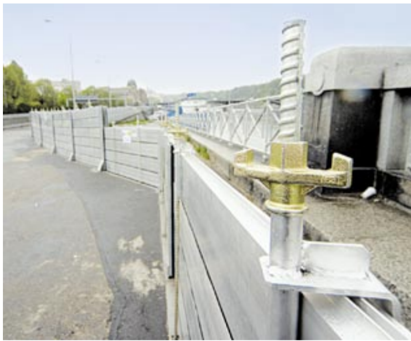
ÚČINNÁ OCHRANA. Mobilní protipovodňové stěny tvoří základ ochrany ohrožených oblastí města před velkou vodou.

Pojízdná uzávěra Čertovky byla jednou z nejsložitějších etap protipovodňové ochrany Malé Strany. Více než padesátitunová vrata byla složena ze čtyř dílů a na místě svařena. Součástí úprav byla i rekonstrukce náběžní zdi, za kterou bude uzávěra v normálním stavu schována. Do horní části hradič stěny jsou osazeny slupice pro zasunutí hliníkových hradičidel a hrazení takto navazuje na mobilní hrazení na přilehlých náběžních zdech. Opatření nena-