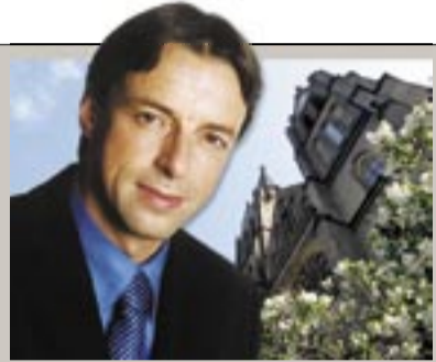
MUDr. PAVEL BÉM primátor hlavního města Prahy