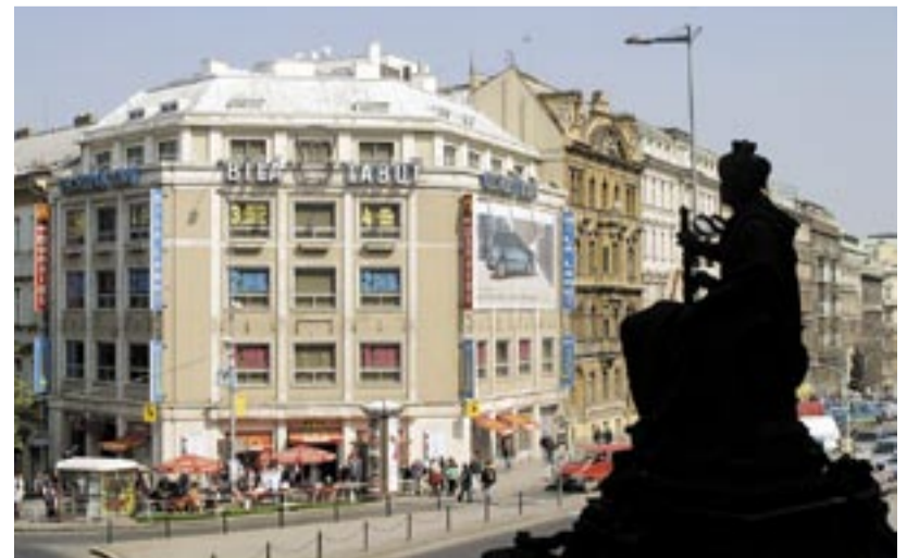
...a po šedesáti letech v květnu 2005.