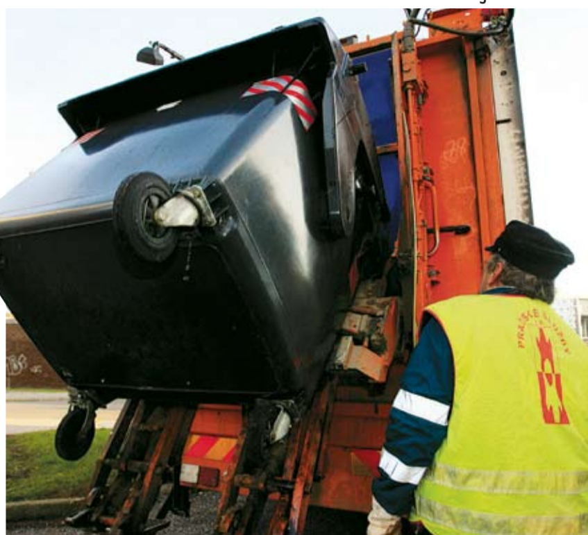
S PRAŽSKOU NEČISTOTOU denně bojuje na tři sta lidí.

Město na zvládnutí svého úklidu každý rok vydá téměř půl miliardy korun. Zajímavým číslem je například položka 16 miliónů, kterou město vynaloží na odstranění „děl“ sprejerů jen z vozidel MHD. A další čísla: každý den vyjždí za úklidem 157 úklidových vozů, 44 zametacích vozů a stejný počet vozů kropicích, dále 51 multikár, 12 vozů na svoz odpadkových košů a 9 nakladačů. Co se týká lidí, s pražskou nečistotou jich denně bojuje na tři sta lidí.