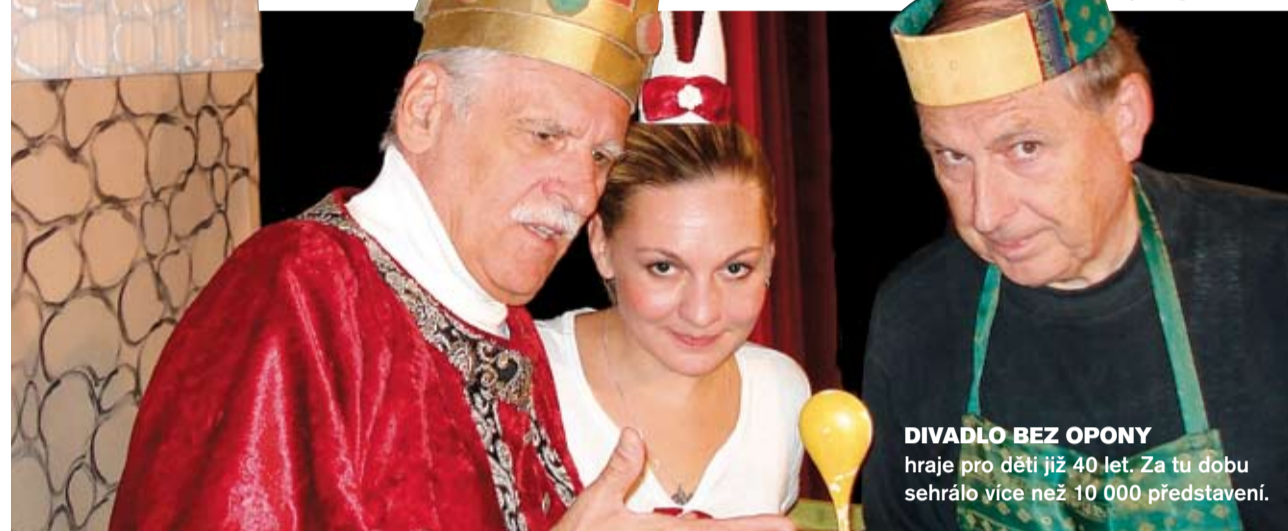
DIVADLO BEZ OPONY hraje pro děti již 40 let. Za tu dobu se hrálo více než 10 000 představení.

Metropole v souladu s prioritami své kulturní politiky podporuje navíc mnoho dalších souborů, které hrají pro děti a mládež, a to v rámci svého propracovaného grantového systému. Prostory náležejí v některých divadlech, Buchty a loutky ve Švandově divadle, ostatní, například Divadlo bez opony, Divadlo AHA! , vystupují v kulturních domech, na menších scénách anebo přímo ve školách. Skladba je pestrá a nabídka dětských představení