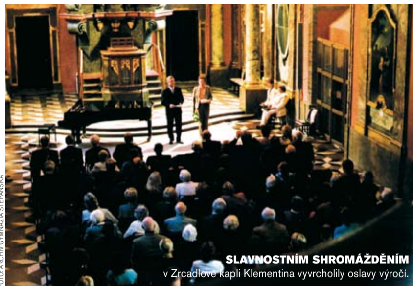
SLAVNOSTNÍM SHROMÁŽDĚNÍM v Zrcadlové kapli Klementina vyvrcholily oslavy výročí.

Mezi žáky, profesory a ředitele školy patřily osobnosti jako Bohuslav Balbín, Josef Jungmann zde promlouval v době národního obrození k „mládeži české“ a jeho přednáškám naslouchal i K. H. Mácha, dále Václav Kliment Klicpera, Josef Kajetán Tyl, František Ladislav Rieger, Bedřich Smetana, Josef Václav Frič, Vítězslav Hálek, Miroslav Tyrš, Jan Neruda, Karel Čapek, Jan Masaryk, profesor Heyrovský a mnoho dalších.