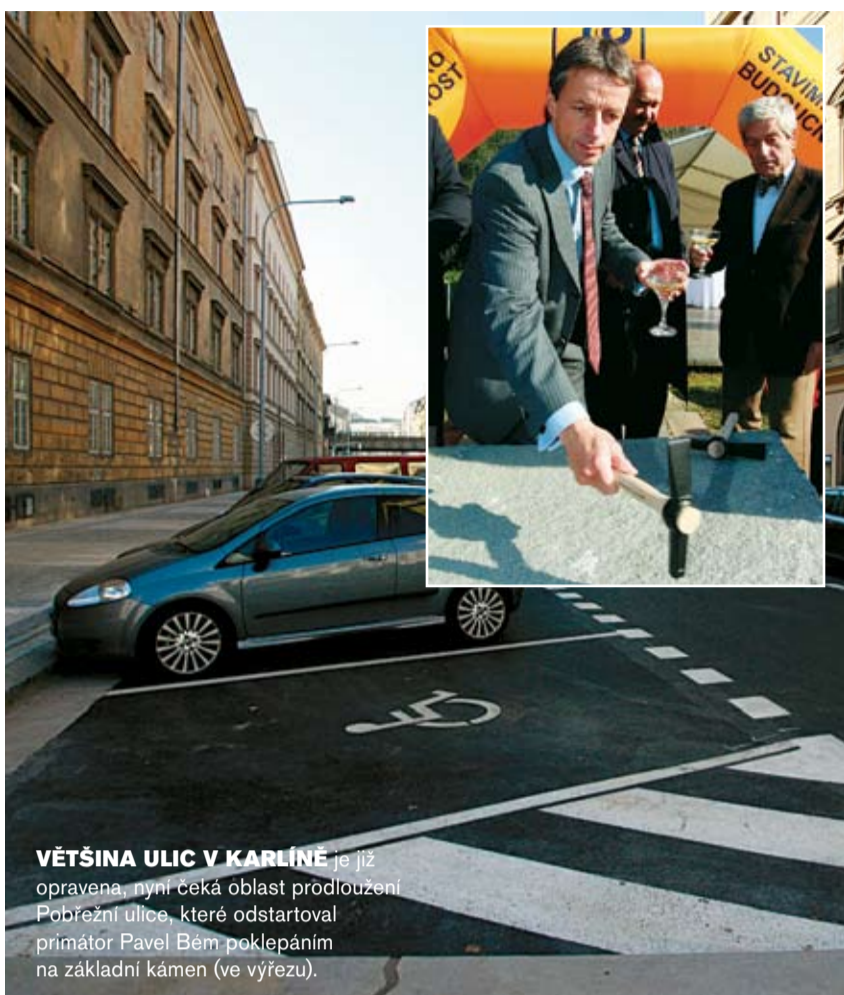
VĚTŠINA ULIC V KARLÍNĚ je již opravena, nyní čeká oblast prodloužení Pobřežní ulice, které odstartoval primátor Pavel Bém poklepáním na základní kámen (ve výřezu).