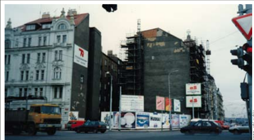
JIRÁSKOVO NÁMĚSTÍ v roce 1994, dole současný stav s Tančícím domem.