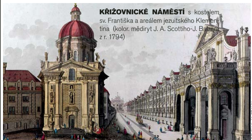
KŘÍŽOVNICKÉ NÁMĚSTÍ s kostelem sv. Františka a areálem jezuitského Klementina (kolor. mědiryt J. A. Scottiho-J. Balzer z r. 1794)

Osvobození Vídně z tureckého obležení v létě 1683 se stalo strategickým zlomem, který ukončil stošedesátiletou expanzi osmanské říše do střední Evropy, ale také mezníkem, který ve svých důsledcích ovlivnil další vývoj jednotlivých součástí habsburské monarchie i jejich hlavních měst. Praha, rezidenční město a metropole českého království, sice nadále hospodářsky vzkvétala a měnila se rok od roku stovkami přestavb i novostaveb skvostně umělecky vybavených barokních chrámů, šlechtických paláců a domů bohatých i méně zámožných měšťanů, tento stavební a umělecký ruch ani lesk a nádhera četných barokních slavností a svátků však nemohly zastřít skutečnost, že poté, kdy pominulo ohrožení Vídně Turky, Praha ve vládní koncepci císaře Leopolda I. a habsburského dvora definitivně ztratila postavení a význam „záložního“ sídelního města. V podmínkách stále více se centralizující absolutistické monarchie to nemohlo zůstat bez následků. Postupný pokles váhy tradičních stavovských a zemských orgánů sídlících v Praze a přesun všech zeměpanských úřadů do centra moci vedly k naprosté dominanci jedině státní a sídelní metropole – Vídně.