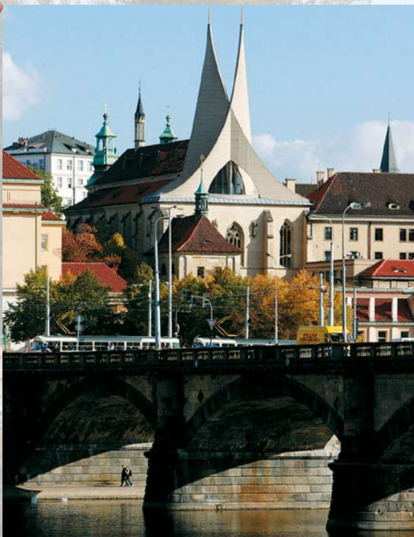
EMAUZSKÝ KLÁŠTER s věžemi ve tvaru býčích rohů tvoří dominantu Podskalí.