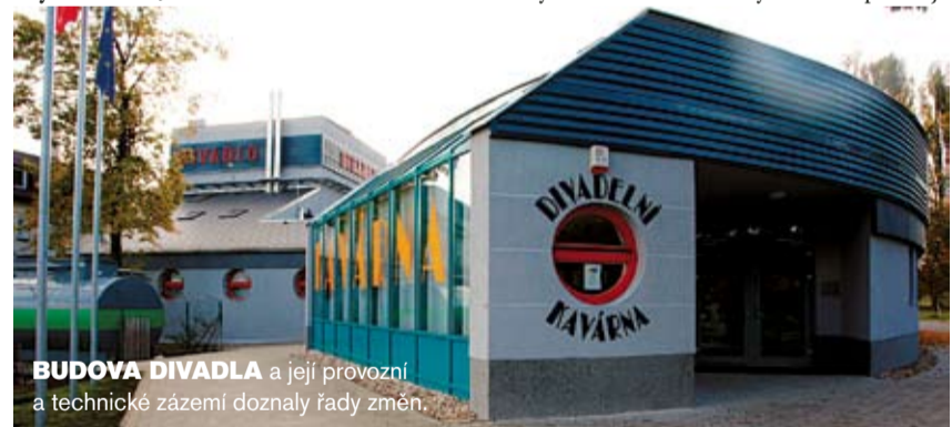
BUDOVA DIVADLA a její provozní a technické zázemí doznaly řady změn.