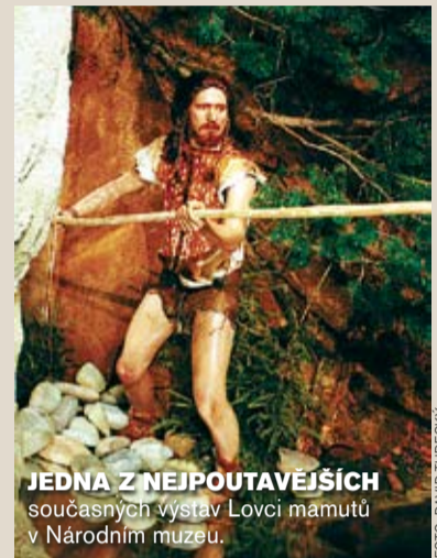
JEDNA Z NEJPULÁRNĚJŠÍCH současných výstav Lovci mamutů v Národním muzeu.

O čtyři roky později následovalo průkopníka pražských muzeí Uměleckopřírodovědné muzeum. Společně s ním vznikla i stejnojmenná škola, na jejíž chod – jakož i na samo muzeum – poskytl potřebné finance Zemský sněm Království českého, Obchodní a živnostenská komora, pražská obec a rakouská vláda.