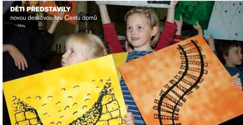
DĚTI PŘEDSTAVILY novou deskovou hru Cestu domů

Cesta domů je název nové deskové společenské hry, kterou po jednom z českých útluků pro nemocné – hospiců – pokrtili pražský primátor Pavel Bém a herec Jiří Lábus v rámci Světového dne hospiců. Ten letos připadl na 7. října a připojilo se k němu i hlavní město ve spolupráci s Městskou knihovnou.