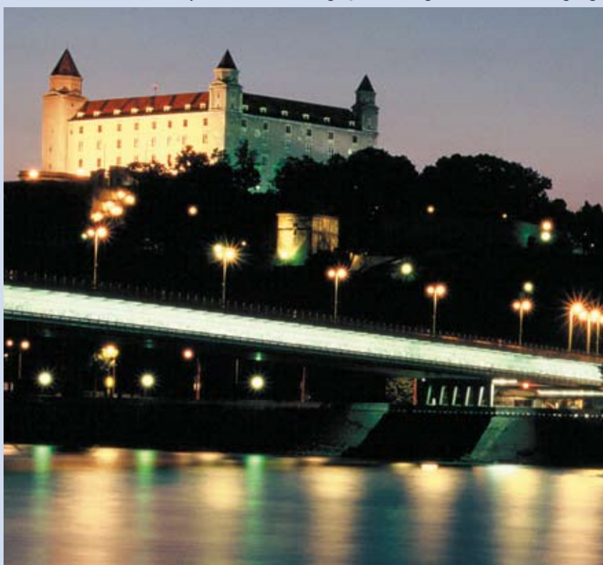
BRATISLAVA JE NEJEN METROPOLÍ S BOHATOU HISTORIÍ, ale také rychle se rozvíjejícím regionem EU.

Ještě v devadesátých letech působila Bratislava trochu maloměstským dojmem, avšak dnes je město s více než 425 500 oby-