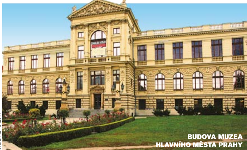
BUDOVA MUZEA HLAVNÍHO MĚSTA PRAHY

Po vzoru francouzských osvicenců-encyklopedistů si lidé stále více uvědomovali, že je nutné najít způsob „soustředění a uchování dokladů života současného i minulého“ pro rozvoj vědy i pro budoucí