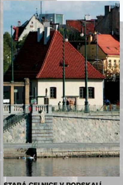
STARÁ CELNICE V PODSKALÍ má také bohatou minulost