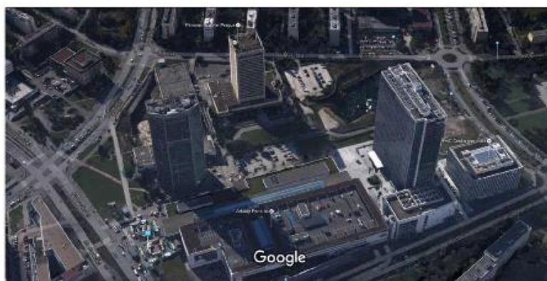
Obr. 1 – Městský blok na Pankráci při pohledu ze severu (2016). Snímek zachycuje tři výškové budovy tak, jak stály v roce 2010, a dříve vykopané základy projektu Epoque (za 107 m vysokou budovou City Tower společnosti ECM projektovanou Richardem Meierem). Vlevo dole je stanice metra.

20 m