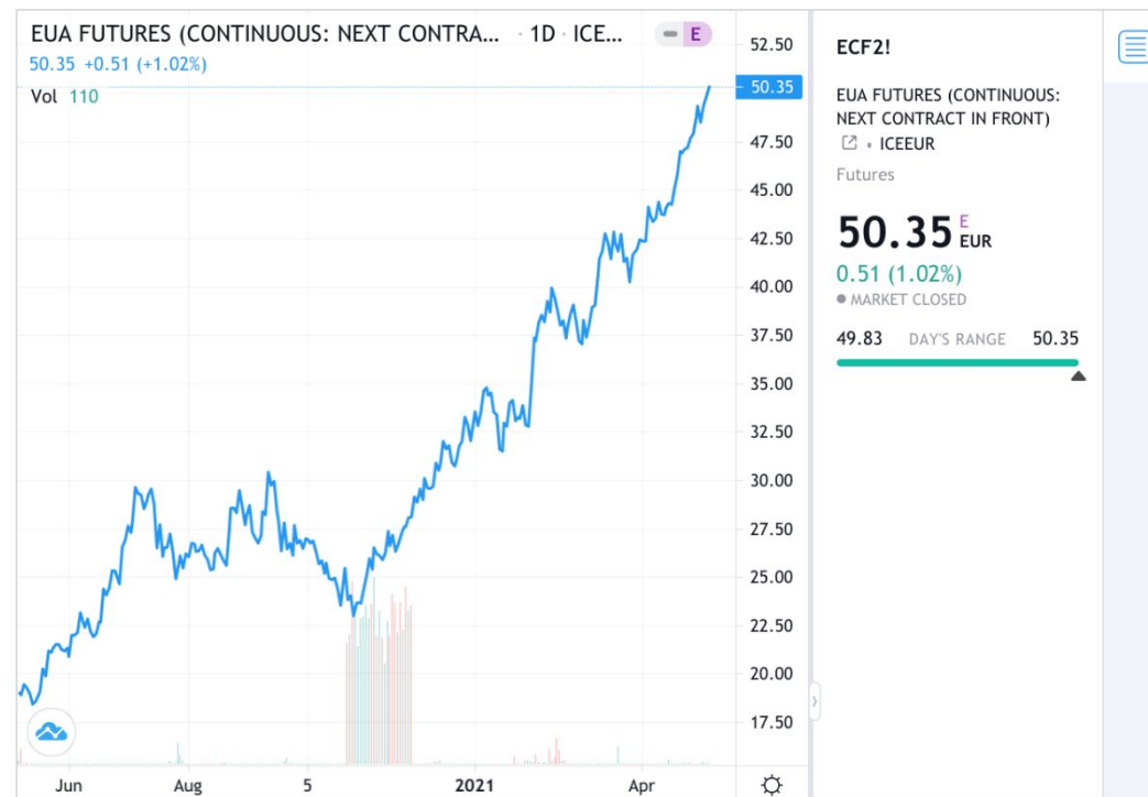
Daily EU ETS carbon market price (Euros)