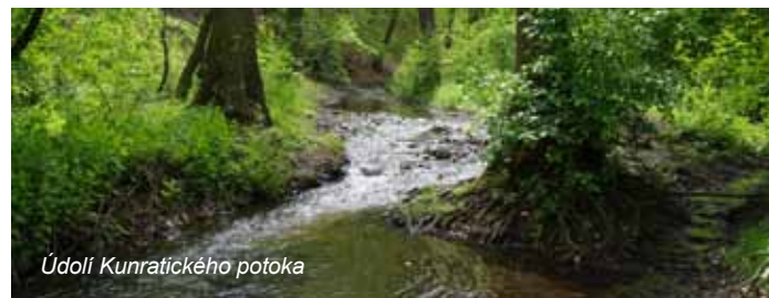
Údolí Kunratického potoka

Pohodlná cesta vás stále společně se žlutou turistickou značkou dovede k restauraci U Krále Václava IV, kde je také dětské hřiště a zookoutek. Dále pokračujte po žluté značce. Zanedlouho minete další restauraci Na Tý louce zelený. Stále pokračujte po žluté značce. Po levé straně budete mít oplocení Thomayerovy nemocnice (8).