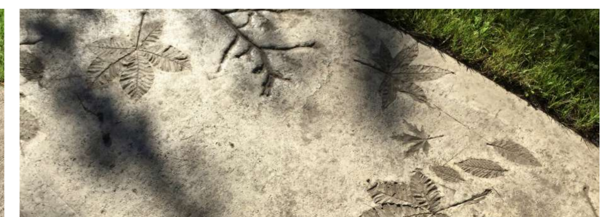
▲ fotografie úpravy povrchu betonu - česaný a ražený beton s listy