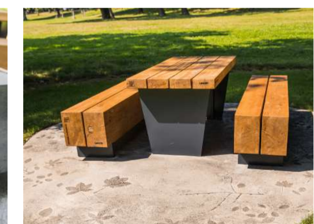
▲ fotografie mobiliáře a grilu