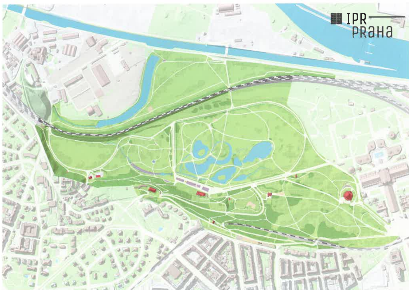
Přehledná situace současného řešení. Institut plánování a rozvoje hlavního města Prahy.