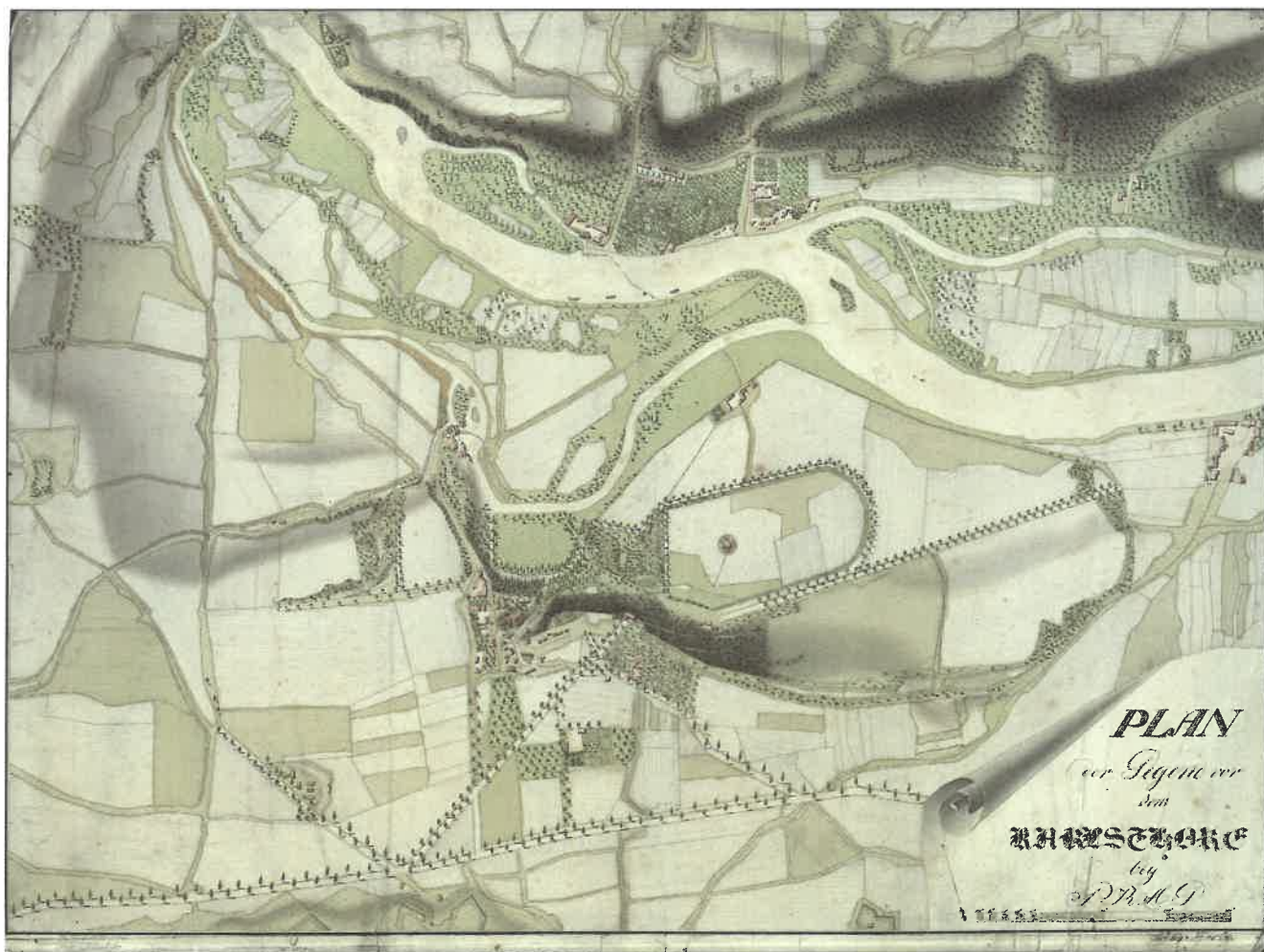
Plán Královské obory s Trojou a okolím, propojení alejí s Bruskou, 1836, kolorovaná kresba.

Uvádí se, že nejstarší obora v Zemích koruny české založil král Přemysl Otakar II. na stráních a plochách katastru obce Přední Ovenec a jejího okolí. Rozsah této královské obory sahal asi od vltavského břehu na území dnešní Letné a části Dejvic a zřejmě se téměř dotýkal areálu pražského Hradu. Královská obora sloužila svému účelu až do roku 1420, kdy obléhání Prahy husity přivodilo tehdy obvyklou katastrofu – zvěř byla vybita (a zajisté i snědena), oplocení zničeno a stromy vykáceny na palivo i pro potřeby obléhání.