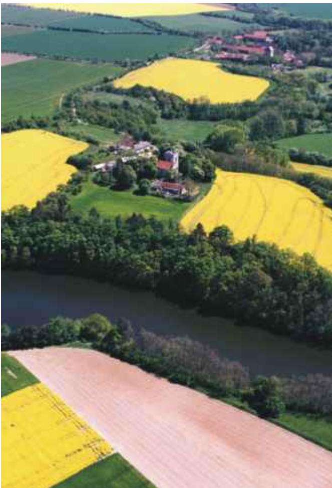
Letecký pohled na sv. Markétu

Při ichtyologickém průzkumu zde byla zjištěna řada druhů ryb. K nejhojnějším patří plotice obecná.