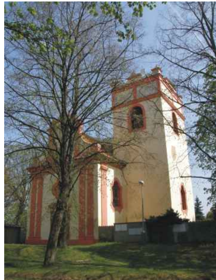
V severní části přírodního parku Rokytky se nachází původně raně gotický kostel sv. Markéty, přestavěný v l. 1739–1740

Na Rokytkce se rozkládá řada menších rybníků, které zlepšují mikroklima okolní krajiny a v minulosti byly i důležitou součástí hospodářského využívání oblasti.