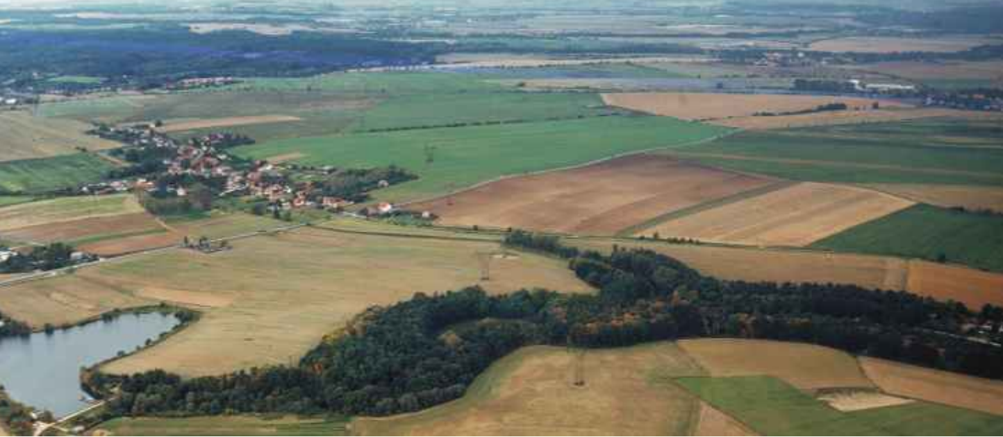
Letecký pohled na zalesněné údolí Rokytky od jihozápadu. V pozadí vlevo Křenice

Osou tohoto přírodního parku je potok Rokytky, který představuje kromě Vltavy a Berounky největší a nejdélní vodní tok na území Prahy (délka toku 36,2 km, z toho 31,5 km na území Prahy).