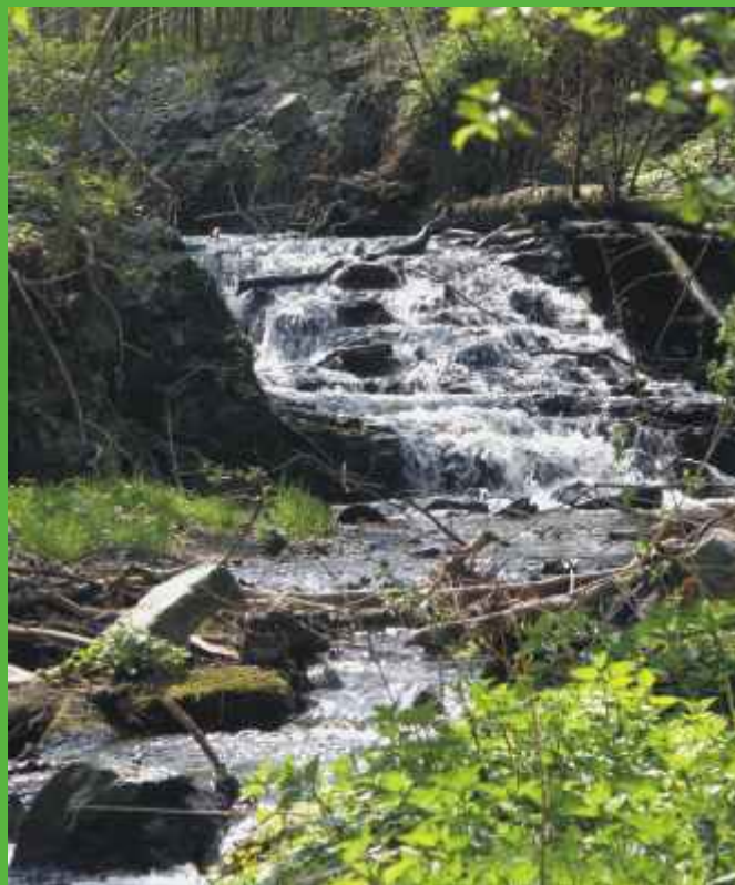
Rokytky vytváří v okolí Královic dokonce peřeje

Park představuje úzký pás zpestřující jinak jednotvárnou polní krajinu, která se táhne po jeho obou stranách. Z hlediska ekologického představuje typický stream-koridor, tj. údolí s vodním tokem umožňujícím šíření různých rostlin i živočichů, kteří se jinak v okolí nevyskytují. V našem případě jde o druhy šířící se z vlhčí, chladnější pahorkatiny na jihu směrem do nižší, odlesněné oblasti dále na severu. Oblast parku i jeho okolí zatím nenabyla příměstského charakteru a zachovala si venkovský vzhled. Přírodní ráz si nejlépe zachovala lesnatá partie nad Nedvězí, kde je dnes vyhlášena přírodní rezervace Mýto. Nejlepší čas pro návštěvu oblasti představuje časné jaro, kdy si můžeme vychutnat krásu hájové květeny v čele se sasankami a dymnivkami.