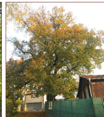
Na fotografiích zleva: Dub severně od Branišovské, Lípa srdčitá Na Šabatce.