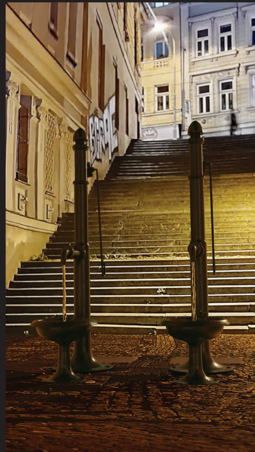
vizualizace v nočním osvětlení, pohled z ulice Chelčického

Realizace počítá s rekultivací historicky cenné dlažby v nejbližším okolí objektu.