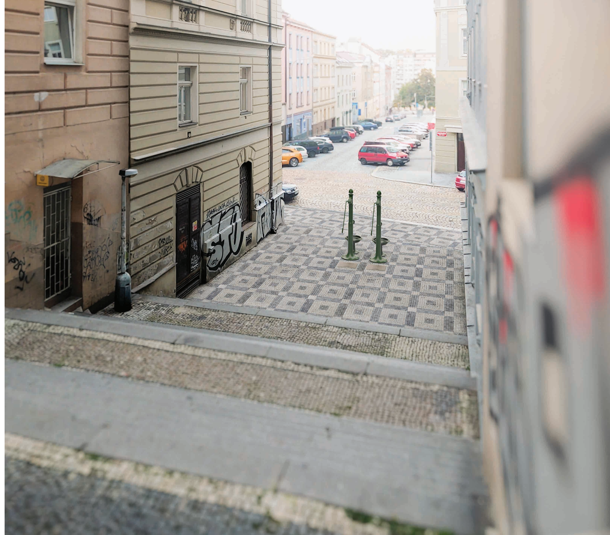
vizualizace, pohled z ulice Táboritská