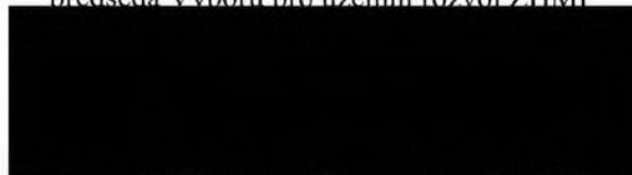
tajemník Výboru pro územní rozvoj ZHMP