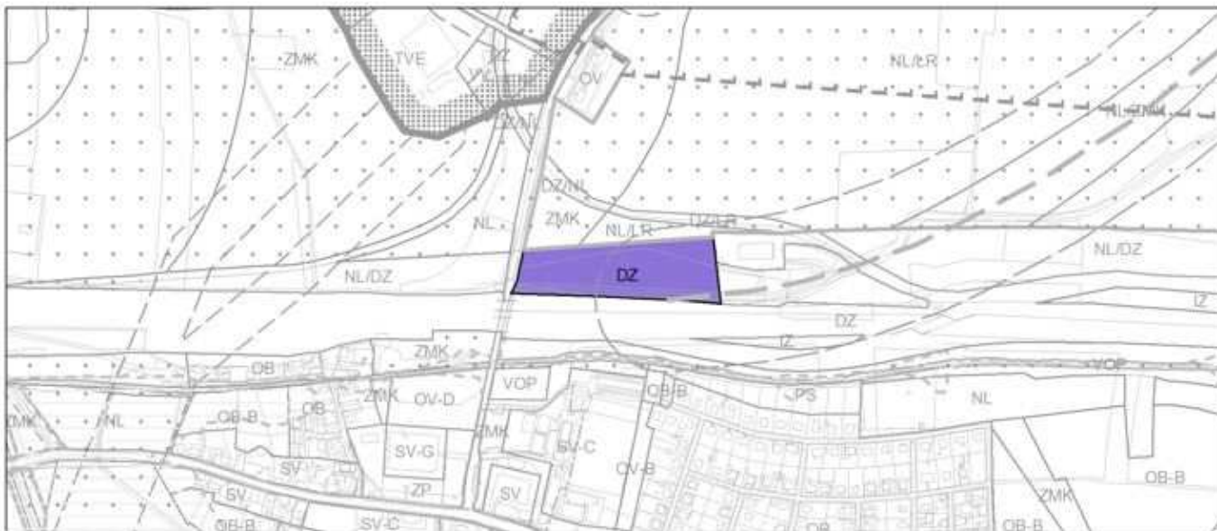
Obrázek 5 Návrh změny ÚP SÚ hl. m. Prahy Z 2939/00 posuzovaný v rámci VVURÚ ve vztahu k výkresu č. 4 – Plán využití ploch

V rámci Vyhodnocení vlivů na udržitelný rozvoj území (EKOLA group, spol. s r.o., 11/2019) bylo uvažováno v předmětném území posuzované změny ÚP SÚ hl. m. Prahy Z 2939/00 o výměře 20 884 m 2 s plochou s rozdílným způsobem využití DZ – tratě a zařízení železniční dopravy, nákladní terminály.