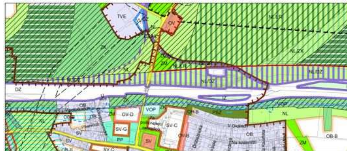
Obrázek 3 Podrobné členění ploch zeleně (výkres č. 31) dle platného ÚP SÚ hl. m. Prahy – stávající stav