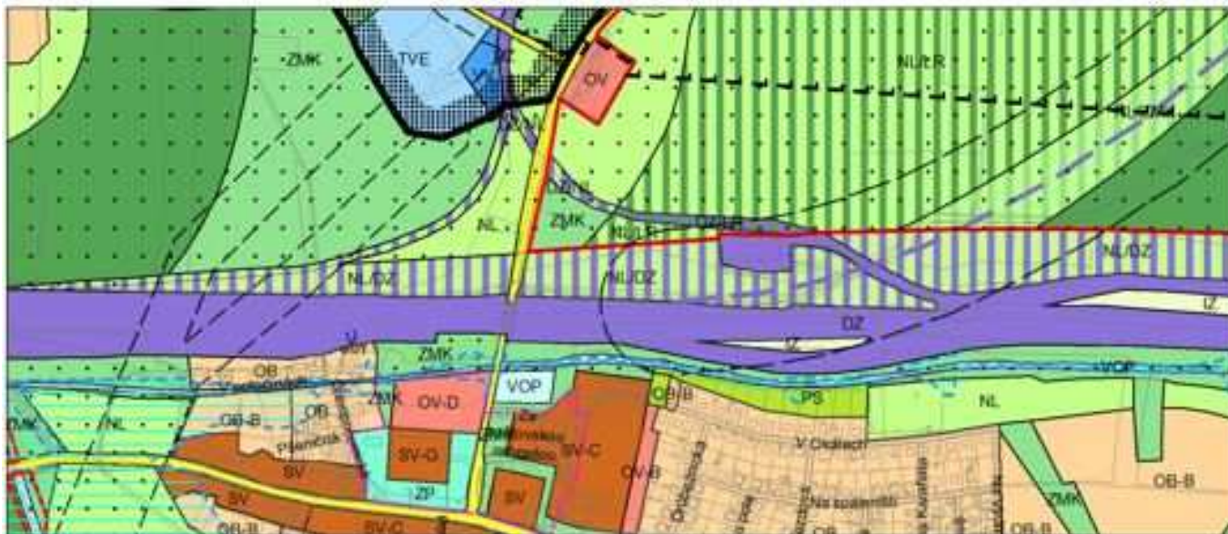
Obrázek 1 Plán využití ploch (výkres č. 4) dle platného ÚP SÚ hl. m. Prahy – stávající stav

Ve stávajícím stavu je zájmové území předmětné změny ÚP SÚ hl. m. Prahy Z 2939/00 vedeno jako plocha s rozdílným způsobem využití území NL/DZ – louky a pastviny s územní rezervou plochy tratě a zařízení železniční dopravy, nákladní.