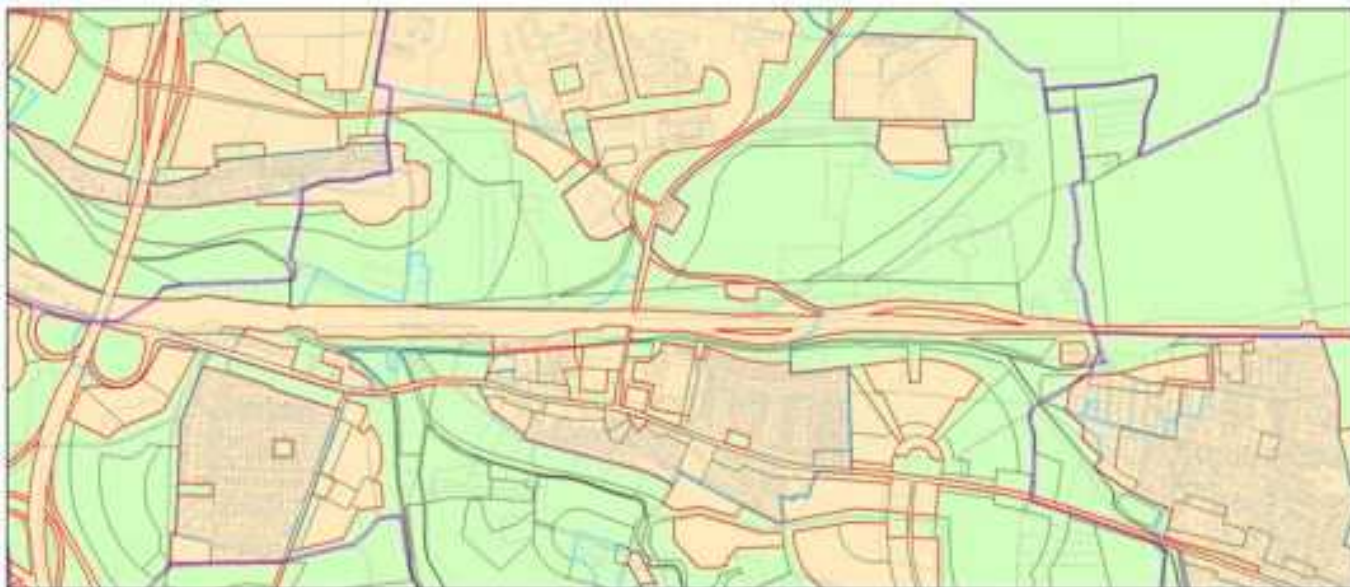
Obrázek 4 Vymezené zastavitelného území (výkres č. 37) dle platného ÚP SÚ hl. m. Prahy – stávající stav